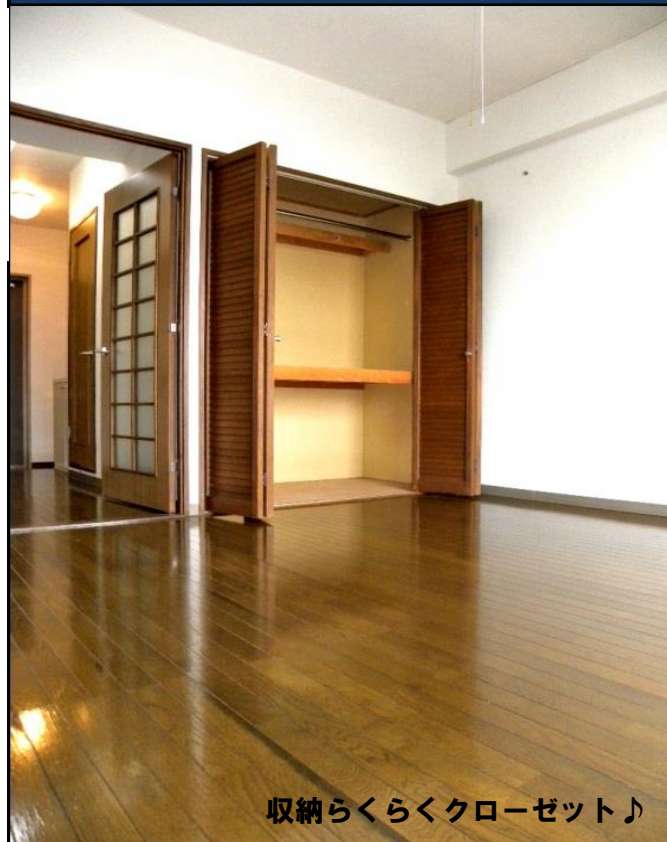
収納らくらくクローゼット♪