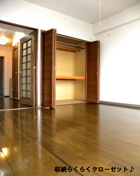
収納らくらくクローゼット♪