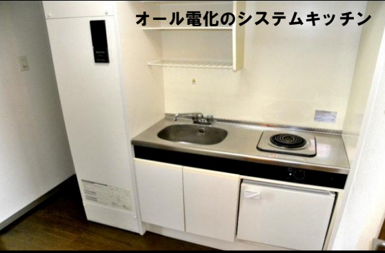
オール電化のシステムキッチン

■ラ・ムール91 ◆所在地/大崎市古川旭2丁目2-32 ◆交通/JR古川駅より徒歩7分 ◆構造/鉄筋コンクリート造5階建 ◆総戸数/全35戸 ◆間取り/1K ◆面積/29.52㎡ ◆築年/1991年3月 ◆設備/ 水洗トイレ、シャワーバス エアコン、電気温水器、下駄箱 一口コンロ、照明、エレベーター、BS 駐車場1台無料、駐輪場 【募集条件】 ◆賃料/42,000円(303・308号室) ◆共益費/3,000円 ◆町内会費/500円(水道料金と徴収) ◆敷金/なし 礼金/なし ◆更新料/賃料の1.08ヶ月分(税込) ◆契約形態/普通賃貸借契約2年 ◆仲介料/賃料の1.08ヶ月分(税込) ◆その他/家賃保証会社利用 家財保険加入2年間15,000円 法人契約の場合 上記同じ 賃料引き落としの際手数料がかかります。