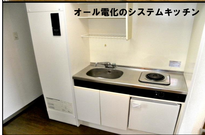
オール電化のシステムキッチン