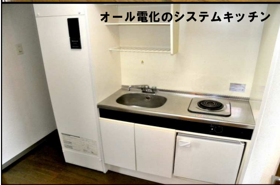
オール電化のシステムキッチン

■ラ・ムール91 ◆所在地/大崎市古川旭2丁目2-32 ◆交通/JR古川駅より徒歩7分 ◆構造/鉄筋コンクリート造5階建 ◆総戸数/全35戸 ◆間取り/1K ◆面積/29.52㎡ ◆築年/1991年3月 ◆設備/ 水洗トイレ、シャワーバス エアコン、電気温水器、下駄箱 一口コンロ、照明、エレベーター、BS 駐車場1台無料、駐輪場 【募集条件】 ◆賃料/42,000円（303号室） ◆共益費/3,000円 ◆町内会費/500円（水道料金と徴収） ◆敷金/なし 礼金/なし ◆更新料/賃料の1.08ヶ月分（税込） ◆契約形態/普通賃貸借契約2年 ◆仲介料/賃料の1.08ヶ月分（税込） ◆その他/家賃保証会社利用 家財保険加入2年間15,000円 法人契約の場合 上記同じ 賃料引き落としの際手数料がかかります。