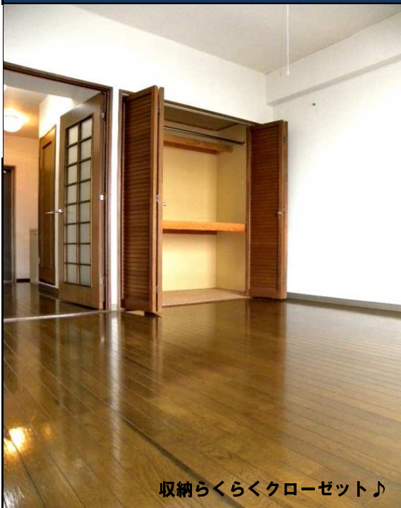
収納らくらくクローゼット♪