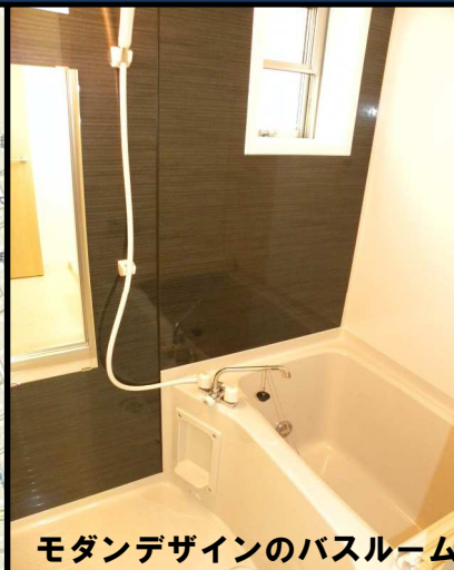
モダンデザインのバスルーム