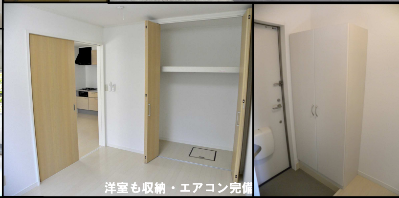
洋室も収納・エアコン完備