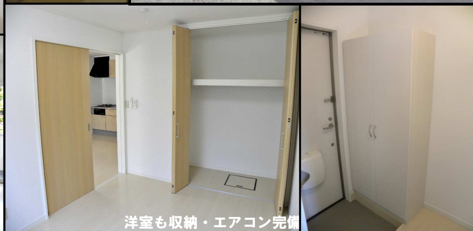
洋室も収納・エアコン完備