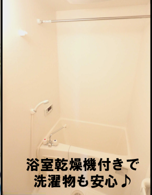
浴室乾燥機付きで洗濯物も安心♪