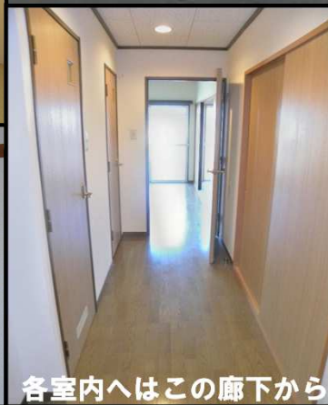
各室内へはこの廊下から