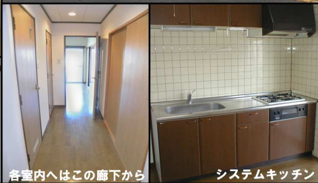
各室内へはこの廊下から