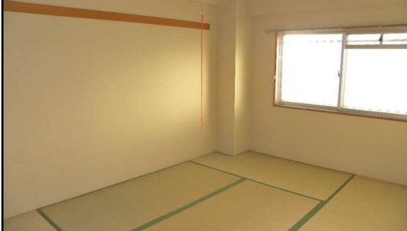
それぞれの和室にひろびろ収納付き！