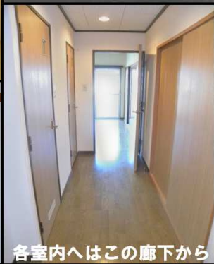
各室内へはこの廊下から