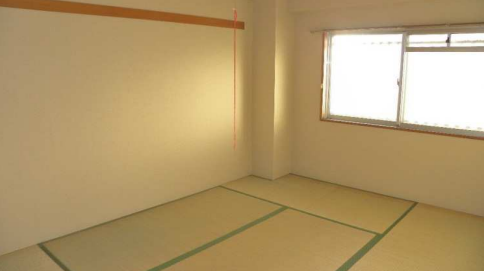
それぞれの和室にひろびろ収納付き！