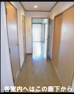
各室内へはこの廊下から