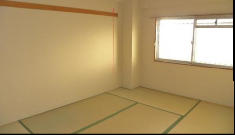
それぞれの和室にひろびろ収納付き！