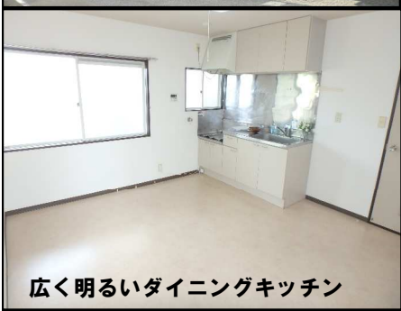
広く明るいダイニングキッチン