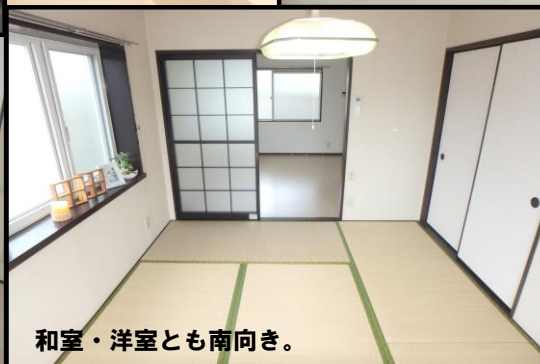
和室・洋室とも南向き。