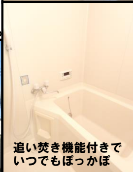
追い焚き機能付きでいつでもぽっかぽ