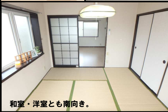
和室・洋室とも南向き。