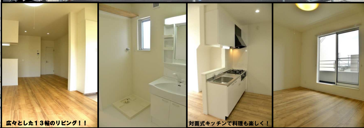
広々とした13帖のリビング！！