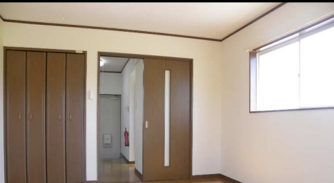
もちろん収納もあります。