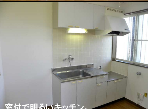
窓付で明るいキッチン。