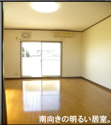
南向きの明るい居室。