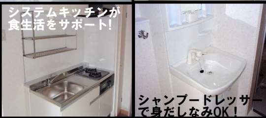
システムキッチンが食生活をサポート!